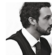
Esperto in tecniche di formazione esperienziale, direttore presso Accademia Internazionale del Musical, formatore per attori professionisti