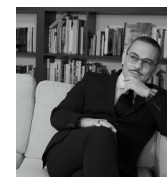
Formatore, esperto in negoziiazione e gestione del conflitto